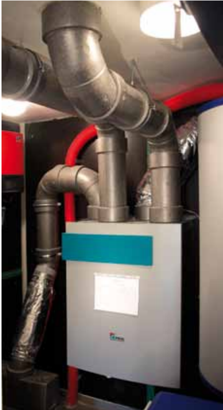
ventilatie-unit, aan en afvoer