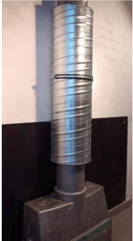
demper op ventilatiekanaal