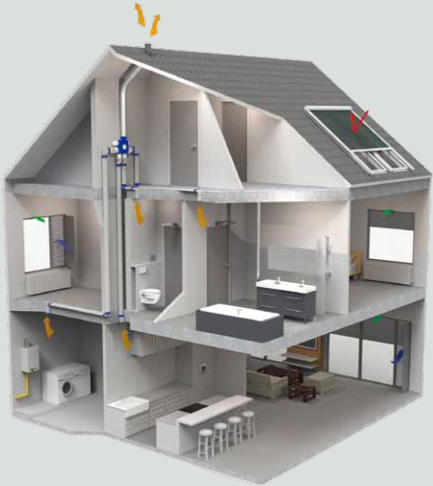
Systeem C: natuurlijke toevoer en mechanische afvoer